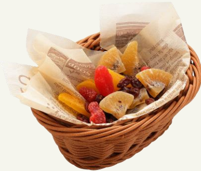
ドライフルーツ 500 Dried fruit