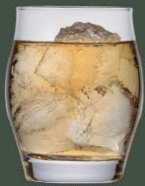
& water 【水割り】