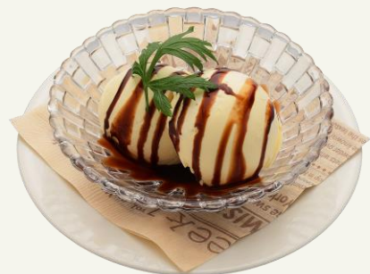
バニラアイス 500 バーボンチョコソース