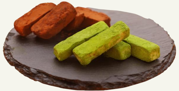
チョコレート盛合せ 830 Homemade raw chocolate

ハイボールのアテとして楽しむスイーツ。 ベとしてだけでなく、 いきなりいっちゃってもいいんです。