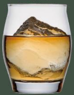
half rocks 【ハーフロック】