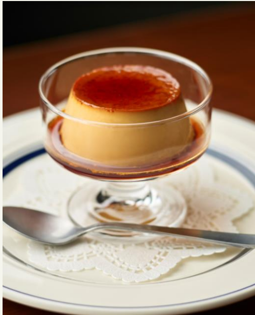
洋酒キャラメルの黒糖プリン 600 Raw Sugar Pudding

バーボン樽の香りをつけたキャラメルソースを乗せた洋酒と楽しむためのスイーツです。