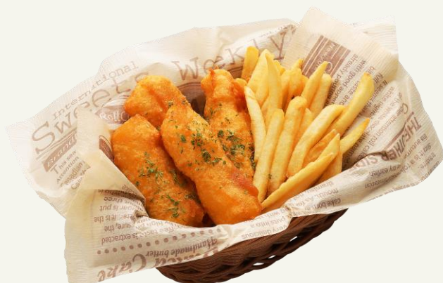
フィッシュ&チップス 830