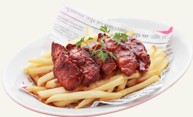
牛ハラミステーキ&ポテト 940