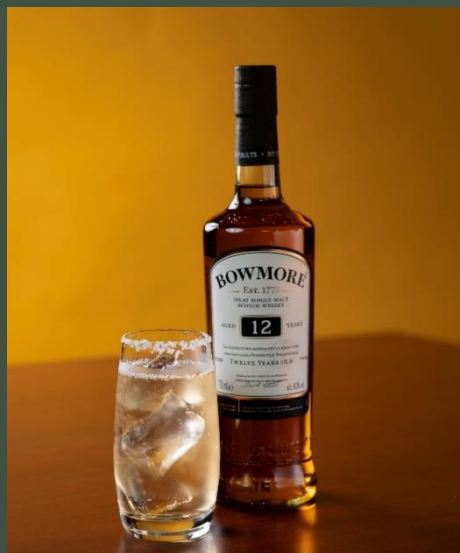
ボウモア12年ハイボール 1,000

マッカランならではのドライフルーツのような味わいは オレンジピールの香りでより引き締まります