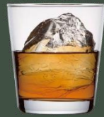
on the rocks 【オンザロック】