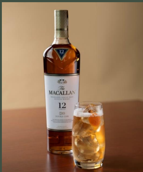
ザ・マッカランダブルカスク12年 ハイボール 1,500

THE MACALLAN DOUBLECASK 12y HIGHBALL The Macallan double cask 12y + Sparkling Water + Dried Grapes