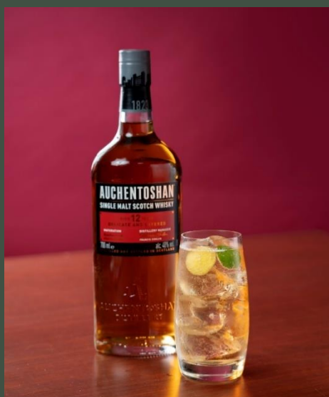
オーヘントツシャン12年 ハイボール 900

“海抜ゼロメートル”で貯蔵される、潮の香りのボウモア グラスにつけた塩と一緒にお試しください