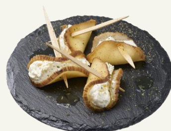
いぶりがっことクリームチーズ

IBURI-GAKKO & Cream cheese 燻(いぶ)した沢庵にクリームチーズの組合せ。 トリュフオイルの香りがポイント。