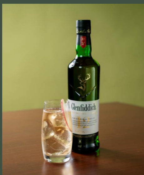
グレンフィディック12年 ハイボール 850

3回蒸溜によるすっきりとした味わいのオーヘントツシャンは レモンとライムのダブルピールでより爽快