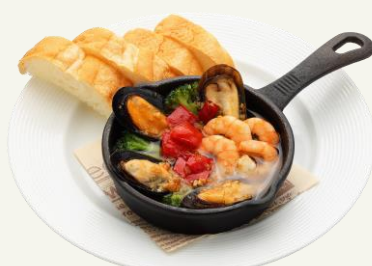
エビとムール貝の アヒージョ 940