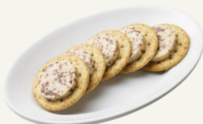
自家製レーズンバター

Whisky Flavored Raisin Butter ウイスキーで漬け込んだレーズンバター どんなウイスキーにもお供します。