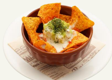
おつまみナチョス 720