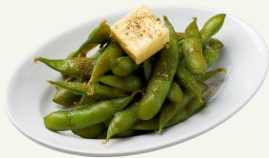
漬け枝豆 黒胡椒とバター