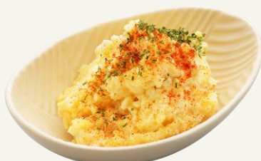
HIGHBALLのための 燻玉ポテトサラダ