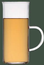
& hot water 【お湯割り】