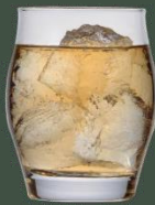
& water 【水割り】