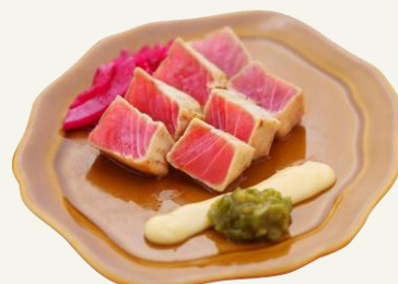
漬けマグロ山葵ソース

ハイボールがより美味しくなる おつまみを各種ご用意しました。 いろいろな種類を気軽に楽しんで いただけるよう、おひとり様でも つまめるサイズです。