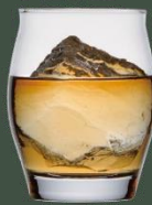
half rocks 【ハーフロック】